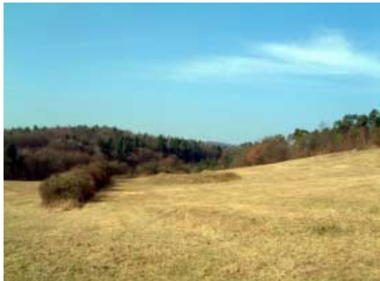
Hier kommt die Einschießbrange hin.