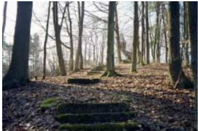
Der alte Wallfahrtsweg verbindet die Lanes.