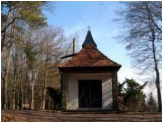
Die St. Barbara-Kapelle: der Start.